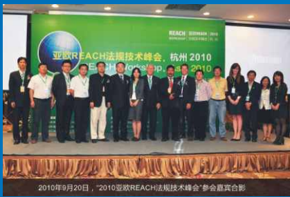
2010亚欧REACH法规技术峰会 REACH Workshop, Asia 2010 http://2010.reachworkshop.org/