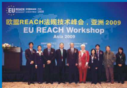
欧盟REACH法规技术峰会，亚洲2009 EU REACH Workshop, Asia 2009 http://2009.reachworkshop.org/